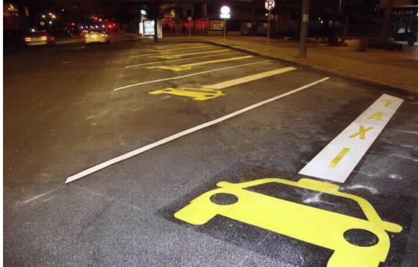
Imagen 6. Pictograma y texto "TAXI" demarcación de piso zona amarilla.