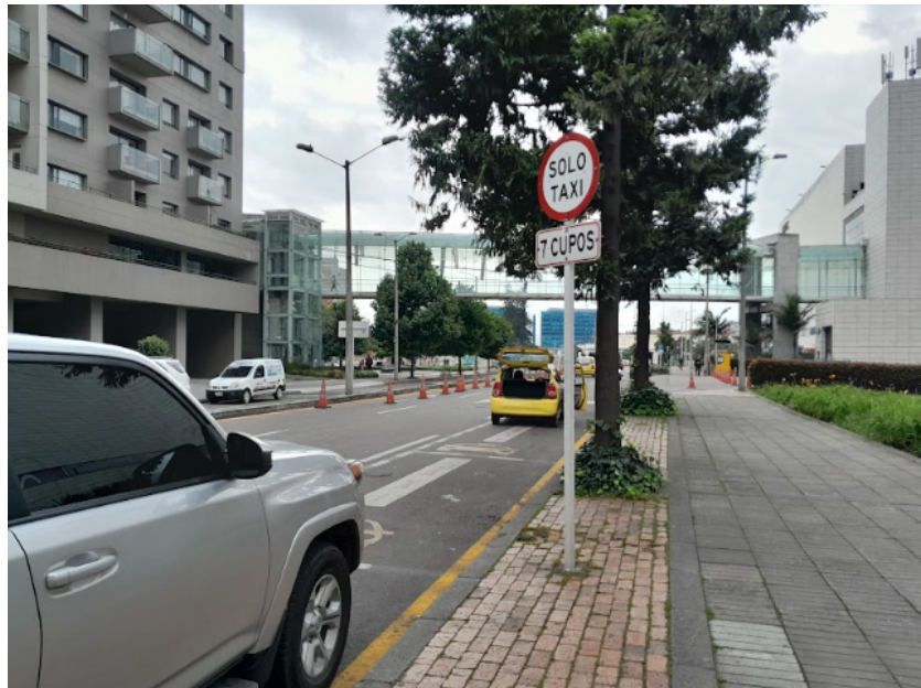
Imagen 5. Señalización vertical existente.