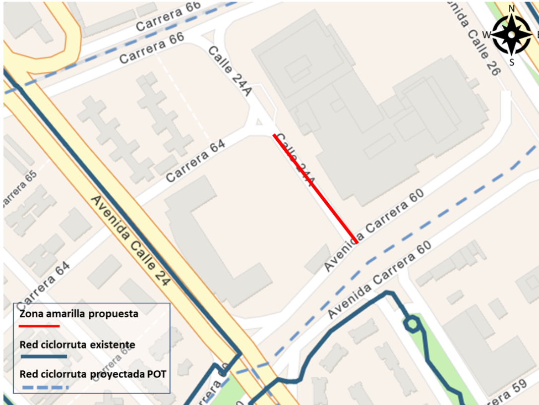
Imagen 4. Localización Cicloinfraestructura AC 24 y proyección Ciclo- Infraestructura POT KR 66 y KR 60

Adicional a lo anterior, cerca de la Zona amarilla y acorde a el actual Plan de Ordenamiento Territorial "Bogotá Verdece 2022 - 2035" adoptado mediante Decreto 555 de 2021, incluye la proyección de la red de ciclorruta sobre la KR 66 y AK 60, sin embargo está no tendrá interacción directa con la zona amarilla propuesta. (Ver Imagen 5).