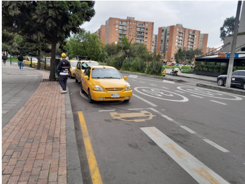
Imagen 2. Perfil vial existente.